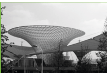
Centro de Exhibiciones